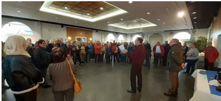
Le discours du président