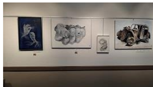
et ses œuvres en noir et blanc

N'oublions pas l'équipe animée par Dany, qui a préparé toutes les tables.